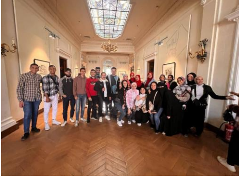
زيارة قصر عائشة فهمي